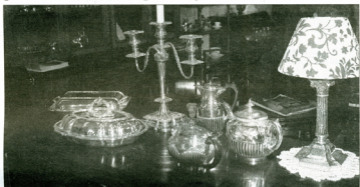
Le rendez-vous des amoureux des beaux objets.

■ Le 38ème Salon des Antiquaires et de la Joaillerie ouvre ses portes du jeudi 30 octobre (14h) au lundi 3 novembre (15h) au Palais de l'Europe du Touquet.