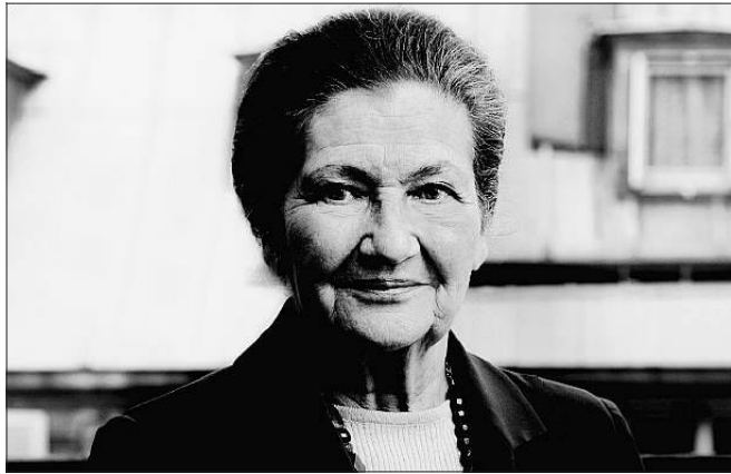
Simone Veil est l'invitée d'honneur du salon. Elle y sera le samedi 8 novembre.

■ Cette année encore le Salon du Livre du Touquet confirme son ambition de devenir « une référence culturelle », reconnue pour sa programmation pertinente et sa diversité éditoriale. Un programme ambitieux et éclectique pour un Salon ouvert aux nouvelles tendances car il semblerait que John Ruskin ait raison : « Les livres peuvent se diviser en deux groupes : les livres du moment et les livres de toujours. » Aussi, seront présents des auteurs d'hier, d'aujourd'hui ou de demain ; les locaux et ceux que le PAF s'arrache... Mais devant les interrogations des lycéens ou des passion-