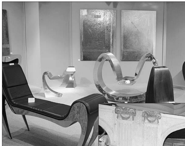
La pureté des oeuvres de Piechaud pour « La Dune »

« Stands » le mot est lâché... bien évidemment il est nécessaire de cloisonner les galeries ou les profession-