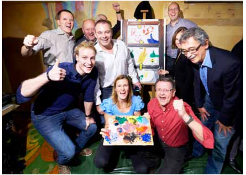
Le résultat, après 45 mn...